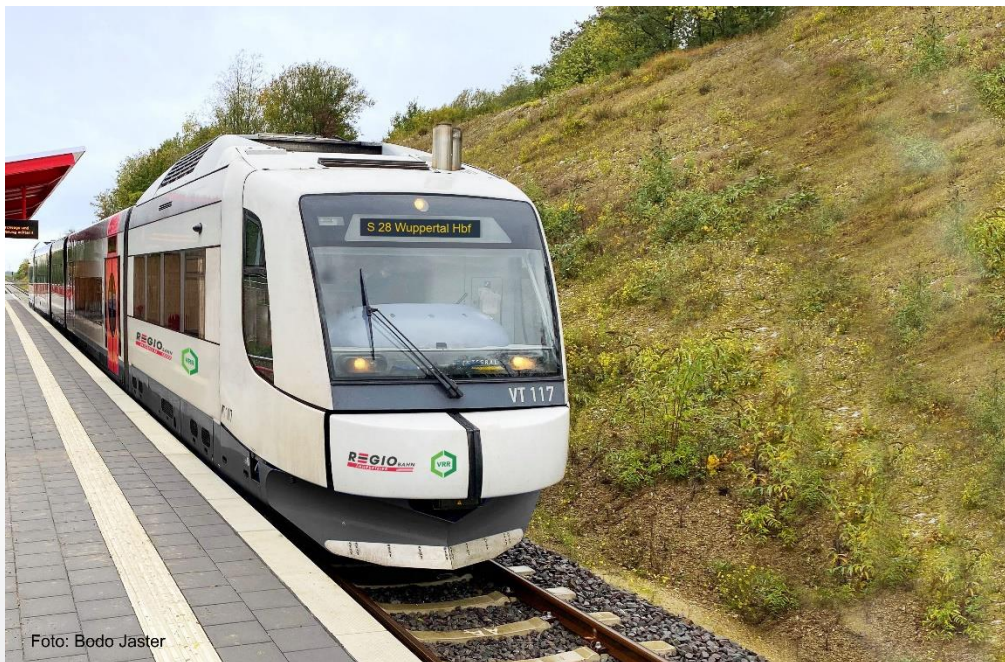
Abb. 1 : Fahrzeug Integral

Bis zur künftigen Elektrifizierung des Regiobahn-Streckennetzes mit einem Umfang von rund 45 Oberleitungskilometern setzt die Regiobahn künftig Fahrzeuge vom Typ Integral ein, die im Rahmen eines EU-weiten Wettbewerbsverfahren von der Bayerischen Oberlandbahn beschafft wurden. Mit dem sukzessiven Einsatz der neuen Fahrzeuge ab Dezember kann dann die Sitzplatzkapazität auf der Strecke ganztagig erhöht werden.