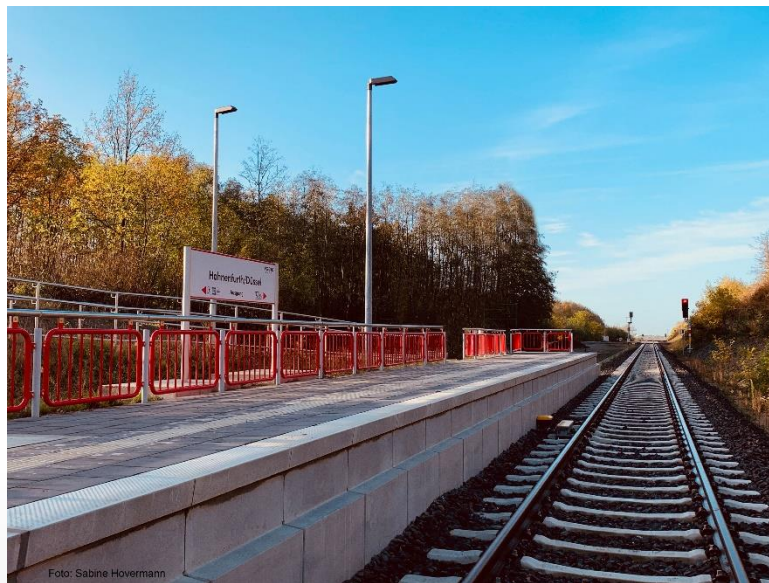
Abb. 3 : Haltepunkt Hahnenfurth / Düssel

sowie vier Busbuchten erstellt. Die Station verfügt auch über Fahrradabstellplätze und wird zukünftig durch regionale Buslinien angebunden.